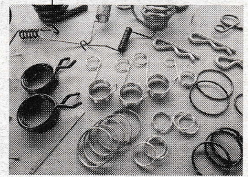
多種多様なバネを取り揃える